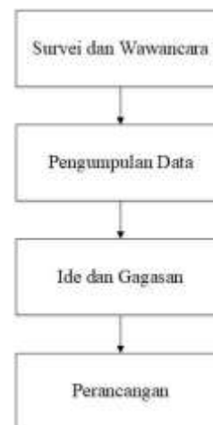
Gambar 1. Tahapan Metode

Pada program Kuliah Kerja Nyata Gagasan Tertulis Mandiri, metode yang digunakan adalah metode deskriptif kualitatif. Dalam metode ini, kualitas riset sangat tergantung pada kualitas dan kelengkapan data yang dihasilkan (Iryana & Kawasati, 1990). Metode pada program ini memiliki empat tahapan, seperti yang ditunjukkan pada Gambar 1.