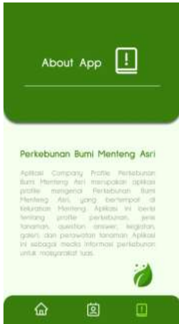
Gambar 8. About App