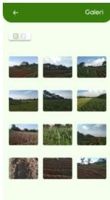
Gambar 12. Galeri