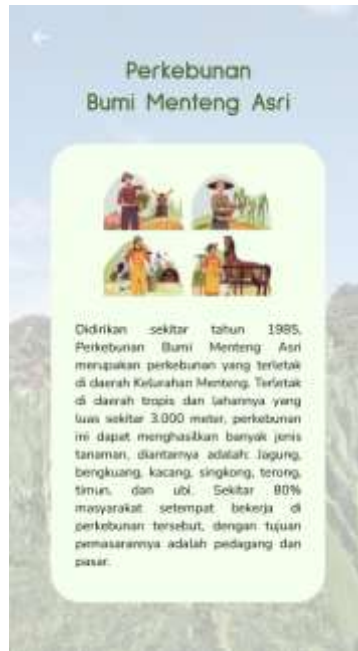
Gambar 9. Profile