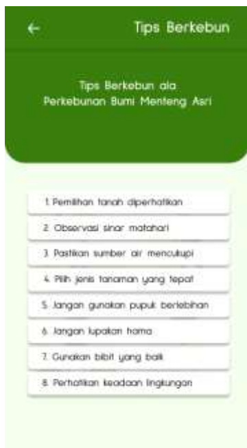
Gambar 11. Tips