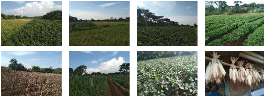
Gambar 2. Perkebunan

Untuk dokumentasi survei dan wawancara, dapat dilihat pada Gambar 3.