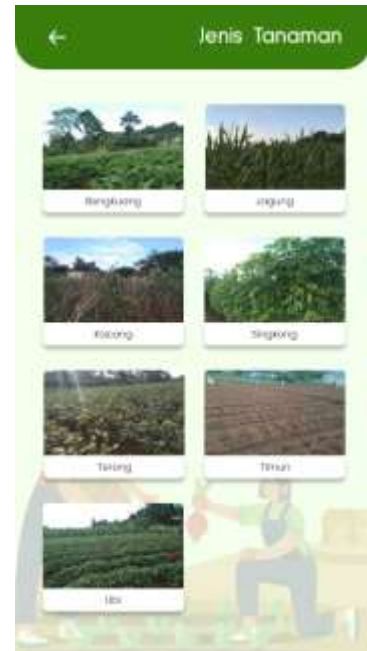
Gambar 10. Jenis Tanaman