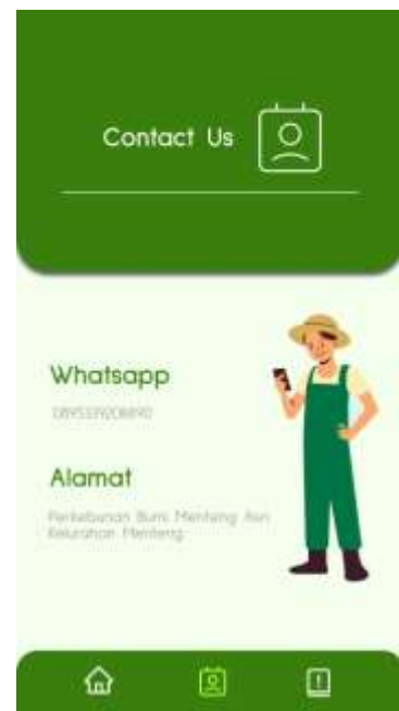
Gambar 7. Contact Us