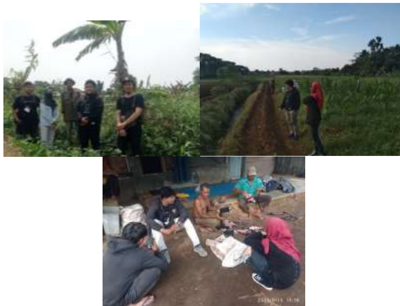
Gambar 3. Dokumentasi survei dan wawancara

Untuk dokumentasi survei dan wawancara, dapat dilihat pada Gambar 3.