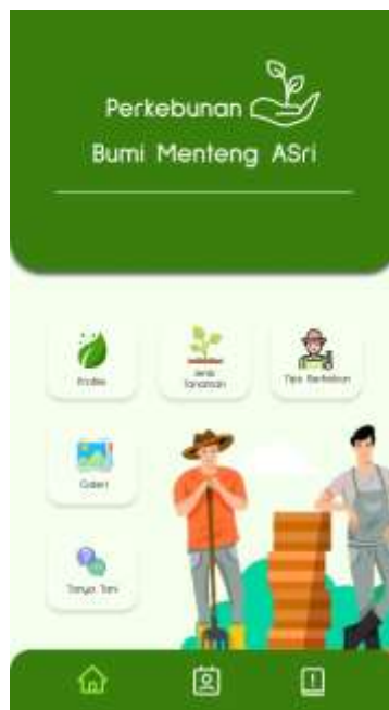
Gambar 6. Home