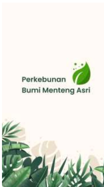
Gambar 5. Splash Screen

Desain sistem aplikasi ini terdiri dari beberapa tampilan, diantaranya adalah: