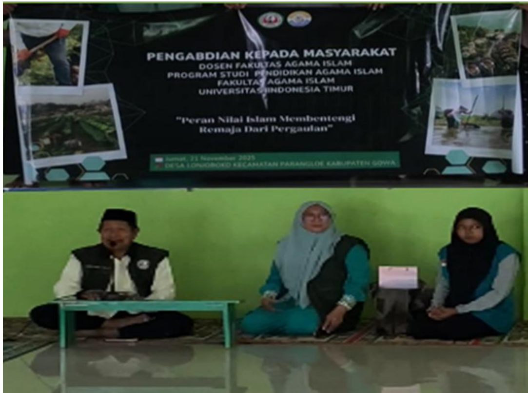
Gambar 2. Penyuluhan Kepada Remaja

Hasil yang dicapai dari pelaksanaan kegiatan pengabdian kepada masyarakat di Desa Lonjoboko Kecamatan Parangloe Kabupaten Gowa adalah: