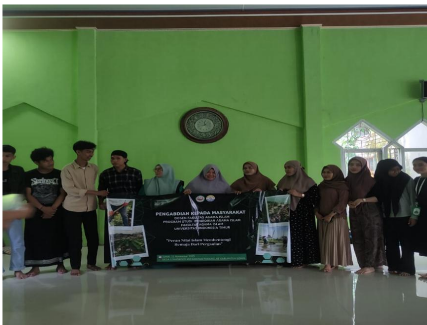
Gambar 3. Foto Bersama Tim PKM dan Para Remaja