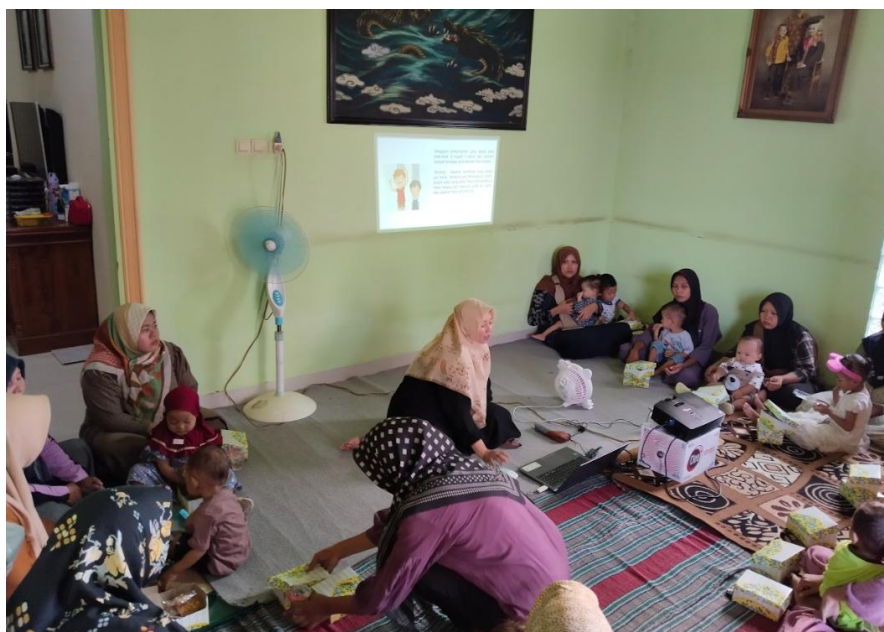
Gambar 1. Sosialisasi

1. Sosialisasi tentang Edukasi kebijakan penanggulangan stunting di Desa Banjarsari Kecamatan Gajah Kabupaten Demak.