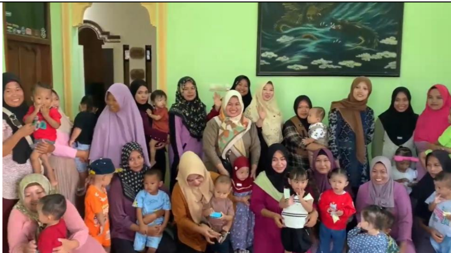
Gambar 3. Pendampingan

Pendampingan dilaksanakan selama 3 bulan berturut turut dan dilakukan satu bulan sekali pada saat kegiatan posyandu stunting di desa Banjarsari kecamatan Gajah kabupaten Demak. Pengambilan data pengabdian masyarakat dilakukan dengan cara survei lapangan terlebih dahulu, yang bertujuan untuk mencari data yang mendukung kegiatan pengabdian kepada masyarakat agar tepat guna sesuai sasaran yang diharapkan. Pendampingan dengan metode kegiatan penanganan stunting dapat menambah pengetahuan dan keterampilan kompetensi dari para kader posyandu dan para peserta PkM [15].