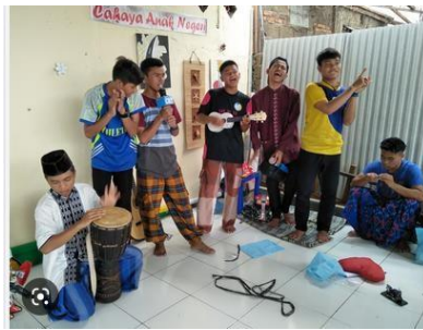
Gambar 2. Ruang Tempat Kegiatan Pengabdian Kepada Masyarakat

Lokasi mitra Jl, KP Pintu Air No 55 RT 002 RW 007 Kel. Harapan Mulya, Kec. Medan Satria, Kota Bekasi. Jawa Barat 17143. Link alamatnya adalah sebagai berikut https://kelembagaan.kemnaker.go.id/home/companies/f51dede1-06b7-499e-88fd-b0765044a65a/profiles