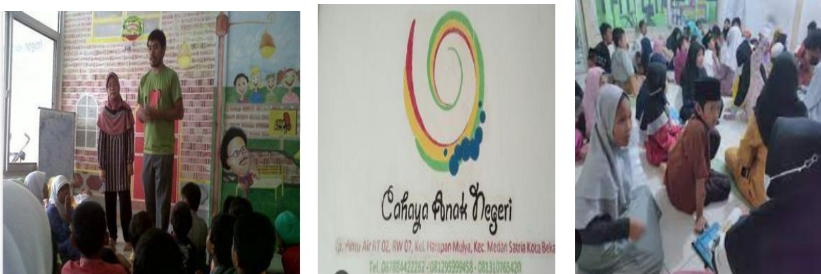
Gambar 1. Lokasi Kegiatan Yayasan Khazanah Kebajikan

Berikut foto – foto kegiatan dilokasi pengabdian masyarakat