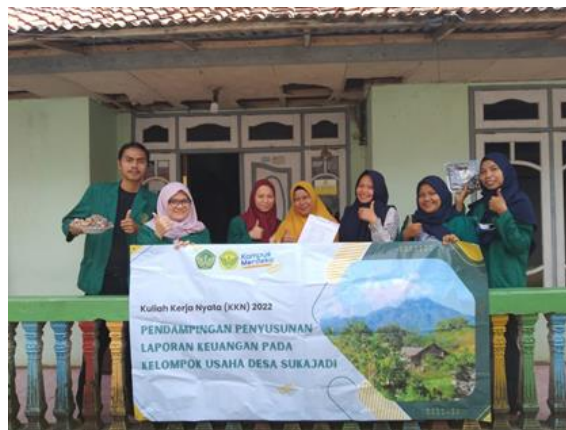
Gambar 6. Berkunjung ke UKM Bibit Strawberry