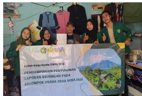
Gambar 8. Berkunjung ke UKM Konveksi