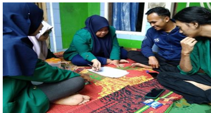
Gambar 11. Pendampingan Penyusunan Laporan Keuangan di UKM Bibit Strawberry