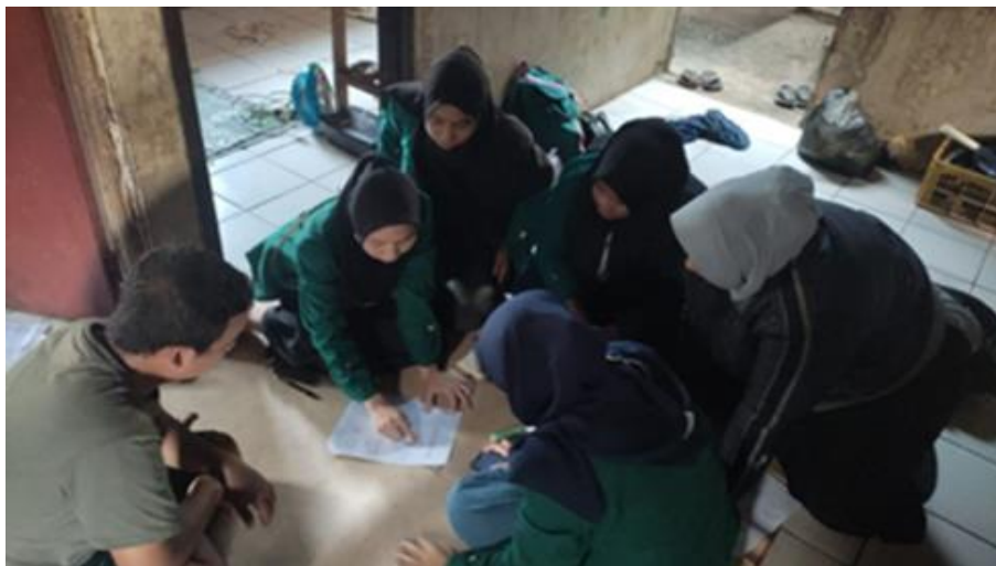
Gambar 9. Pendampingan Penyusunan Laporan Keuangan di UKM Tempe