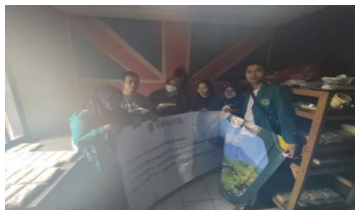
Gambar 4. Berkunjung ke UKM Tempe

Pelaksanaan ini dilakukan selama 3 hari secara informal yaitu mengunjungi tempat UKM-UKM yang berada di kampung tersebut.