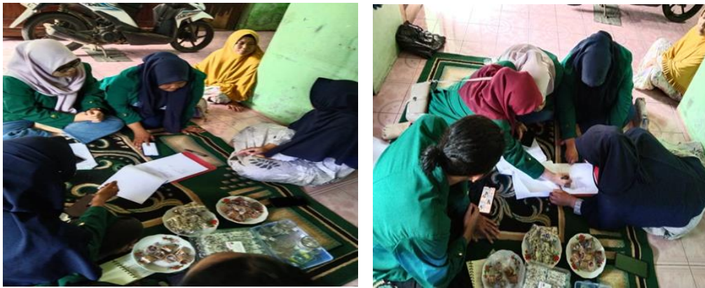
Gambar 10. Pendampingan Penyusunan Laporan Keuangan di UKM Kue Noga