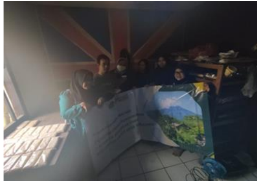
Gambar 5. Berkunjung ke UKM Kue Noga