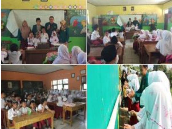
a. Penyuluhan BHBS dan CTPS penyuluhan ini dilakukan di MI miftahul anwar agar mengedukasi mereka supaya hidup bersih

Menurut Eska dalam Jurnal Abdi Dosen Pemberdayaan kesehatan merupakan kegiatan penambahan pengetahuan yang diperuntukan bagi masyarakat melalui penyebaran pesan.