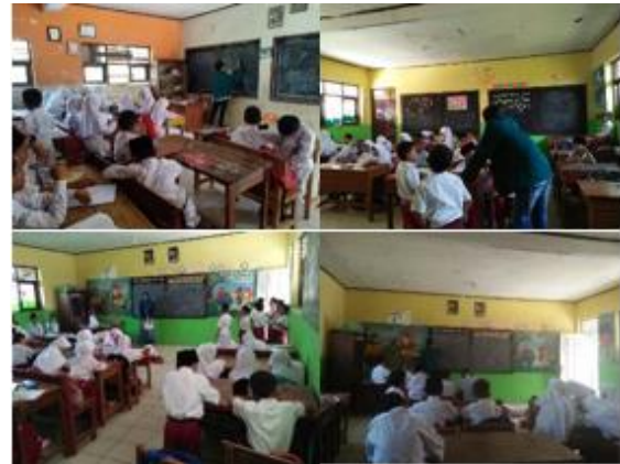
a. Mengajar di MI Miftahul anwar