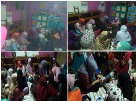
b. Tensi darah dan cek gula darah gratis dilakukan dipengajian ibu-ibu