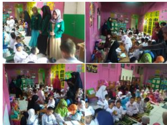
b. Mengajar di Paud