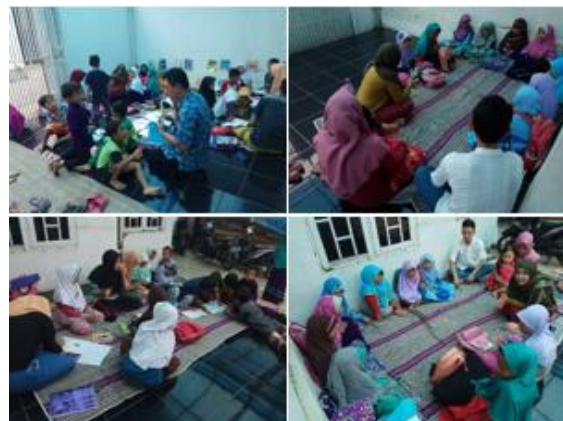
c. Membuka Rumah belajar