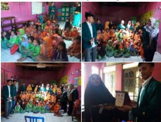
b. Sosialisasi menabung dari 500 rupiah