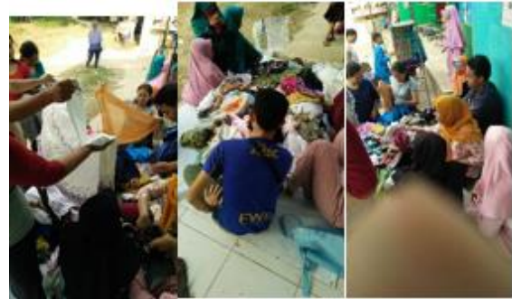
c. Bazar Murah