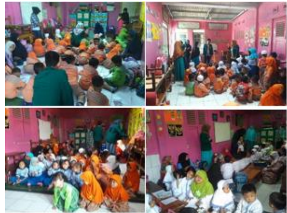
c. Mengajar TPQ