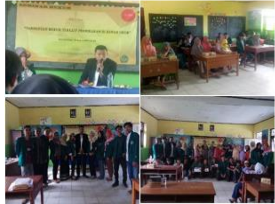
a. Seminar hukum tentang pernikahan diusia dini