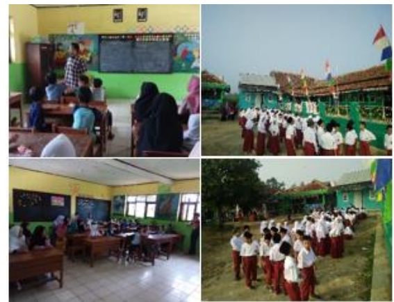
b. Mengajar upacara 17an kepada siswa MI miftahul anwar