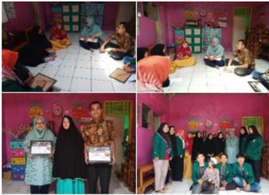
d. Melakukan pelatihan bahasa inggris pada guru paud Pelatihan ini dilakukan untuk mengedukasi tenaga kerja PAUD dengan memberi arahan dan modul pembelajaran