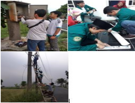
a. Membuat penerangan jalan dan memperbaiki sensor LDR