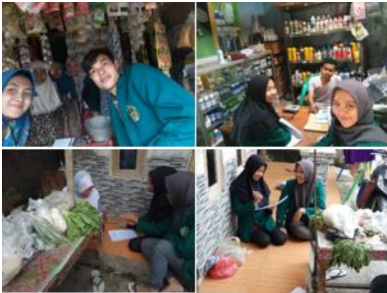
a. Pembukuan kewarung warung