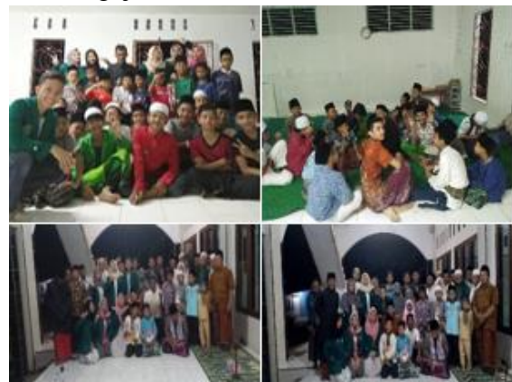
d. Mengajar Pesantren pengajaran dimulai setelah magrib pada hari senin sampai rabu.