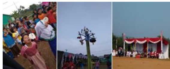
c. Upacara dan perayaan 17an