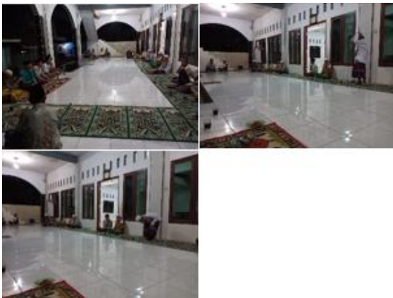
a. Pengajian Bapak-Bapak pengajian ini dilakukan di masjid nurul fallah pada malam rabu setelah isya