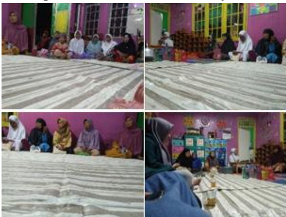
b. Pengajian ibu-ibu pengajian ini dilakukan dipaud riyadhul jannah pada hari minggu ba'da magrib