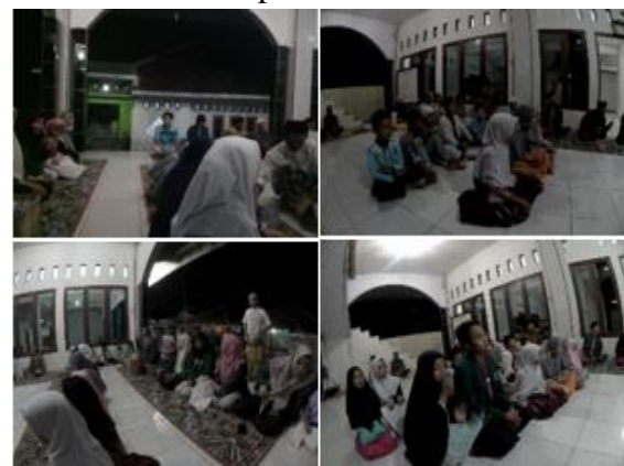
e. Santunan anak yatim + perpishahan