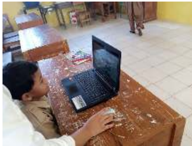
Gambar 3. Pelaksanaan penilaian System usability scale (SUS) AKM Kelas di SD Negeri Curug 02 Jasinga Kabupaten Bogor

sama. Grafik 4 menunjukkan hasil perhitungan rata-rata setiap pertanyaan pada setiap sekolah.