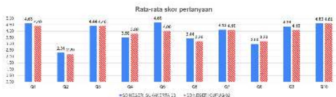
Gambar 4. Grafik Perbandingan Rata-rata skor setiap pertanyaan SUS

Nilai Q1 untuk pertanyaan “Saya menyukai aplikasi ini sehingga akan menggunakannya berkali-kali” yaitu 4.63 untuk SD Negeri Sukakarta 03 Kabupaten Bekasi, 75% siswa menjawab sangat setuju, siswa menyukai aplikasi dan akan menggunakannya lagi. Siswa SD Negeri Curug 02 Jasinga Kabupaten Bogor menjawab sangat setuju sebanyak 60%, maka nilai Q1 adalah 4.40.