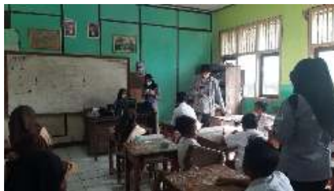
Gambar 4. Pelaksanaan penilaian System usability scale (SUS) AKM Kelas di SD Negeri Sukakerta 03 Kabupaten Bekasi