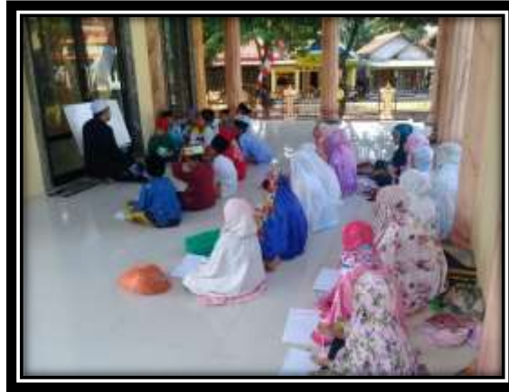
Gambar 4. Foto Aktivitas Pelaksanaan Kegiatan Sosialisasi