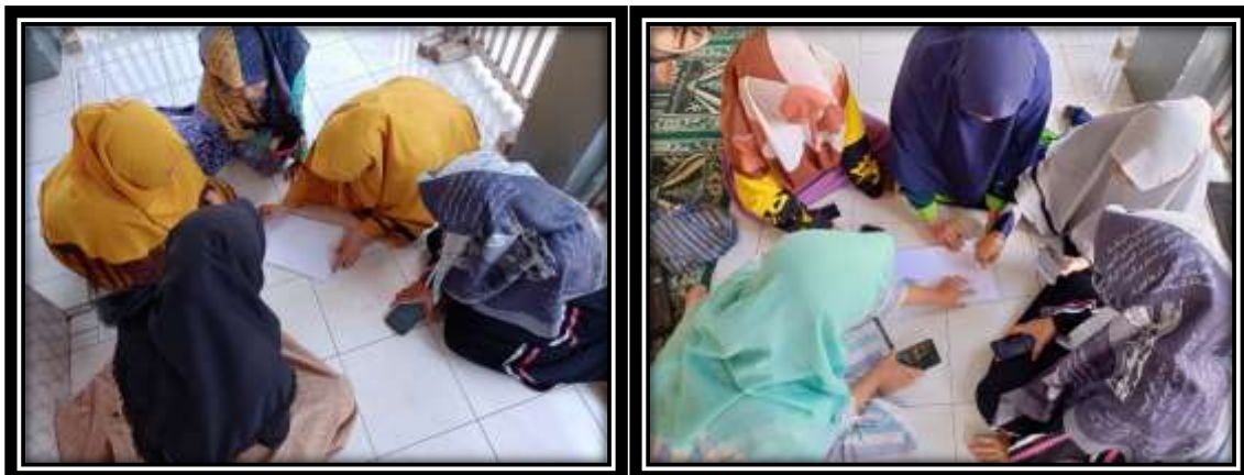
Gambar 2. Masyarakat sedang merancang pemetaan komunitas aset

Tahap kedua yakni, melakukan diskusi dengan komunitas aset. Masyarakat dibagi menjadi lima kelompok berdasarkan dusunnya. Setiap kelompok mendiskusikan dan memetakan aset yang ada di komunitasnya. Proses pemetaan aset masyarakat seperti terlihat pada Gambar 2. Hasil pemetaan komunitas ini menunjukkan bahwa Desa Sentulan memiliki banyak aset. Aset tersebut antara lain Rental Wifi, Sumber Air Sentulan, Industri Telur Bebek, dan Wisata Rekreasi, perkebunan pohon jati, serta kebun pohon sengon dan pinus. Selain itu, di Desa Sentulan terdapat dua Madrasah Ibtidaiyah (MI), antara lain MI Sunan Giri dan MI Miftahul Ulum. Sebagian besar, anak-anak dari masyarakat Desa Sentulan bersekolah di MI tersebut.