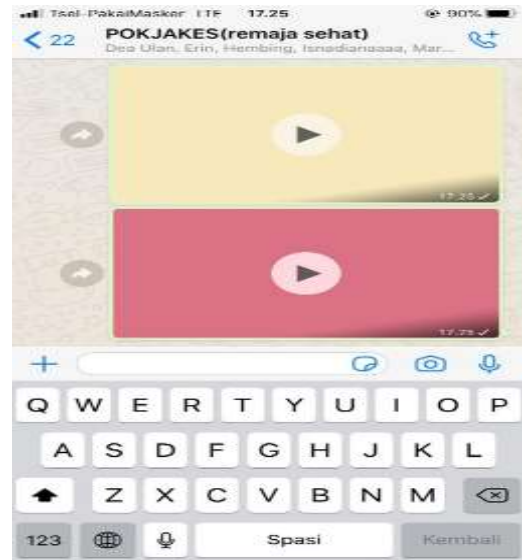
Gambar 4. Edukasi video lewat grup whatsapp