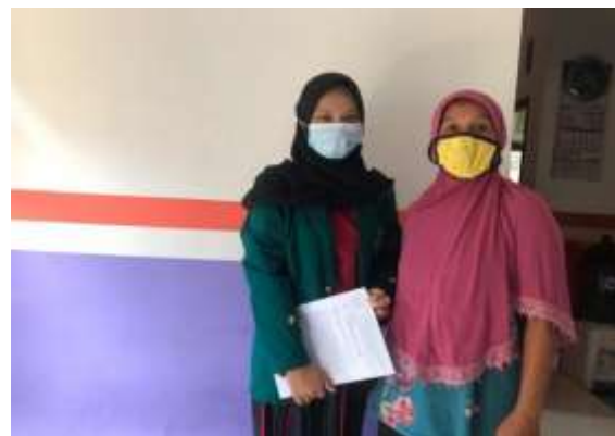
Gambar 1. Izin melakukan kegiatan kepada ibu RT

Salah satu program kerja KKN-GTM adalah pembagian masker gratis sebagai wujud dukungan himbauan World Health Organization (WHO) kepada masyarakat desa Leuwisadeng 001/001 yang menghimbau menggunakan masker pada saat keluar rumah. Pembagian masker di lakukan dengan cara door to door atau dari rumah ke rumah untuk menghindari terjadinya kerumunan warga yang dapat menyebabkan kemungkinan besar terjadinya penyebaran covid-19. Dengan adanya pembagian masker gratis ini dapat membantu masyarakat khususnya yang berada di Kecamatan Leuwisadeng RT 001 RW 001 untuk disiplin menggunakan masker ketika beraktivitas di luar rumah.