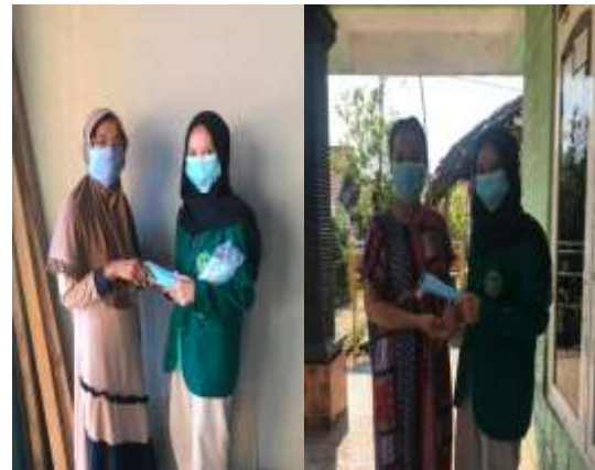
Gambar 6. Pemberian masker gratis