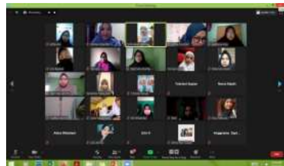
Gambar 5. Kegiatan kelas online bersama peserta dan kader remaja